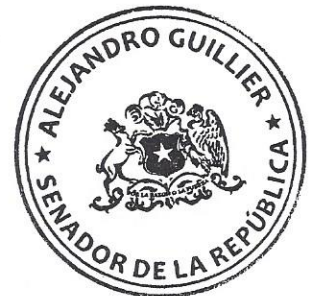
ALEJANDRO GUILLIER A. SENADOR DE LA REPÚBLICA

Yo, ALEJANDRO GUILLIER ALVAREZ, representante de la ciudadanía bajo el cargo de SENADOR DE LA REPÚBLICA, declaro mi patrocinio a la iniciativa juvenil de ley “Modificación a la Ley N°19.451 Sobre Trasplante y Donación de Órganos: Mejoramiento y Optimización de la Donación y Procuramiento de Órganos” presentada por los alumnos del Colegio Nuestra Señora del Carmen , de la Región Metropolitana , dentro del marco del Torneo Delibera 2016