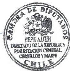
Pepe Auth Stewart Diputado

Yo, Pepe Auth Stewart , representante de la ciudadanía bajo el cargo de Diputado de la República declaro mi patrocinio a la iniciativa juvenil de ley “Modificación a la Ley N°19.451 Sobre Trasplante y Donación de Órganos: Mejoramiento y Optimización de la Donación y Procuramiento de Órganos” presentada por los alumnos del Colegio Nuestra Señora del Carmen , de la Región Metropolitana , dentro del marco del Torneo Delibera 2016