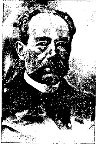
DON ABDÓN CIFUENTES Presidente Honorario de la Convención de 1918