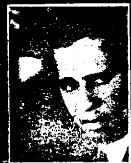
HENRI LOPES (República Popular del Congo), ministro de Relaciones Exteriores, ex Ministro de Educación Nacional.