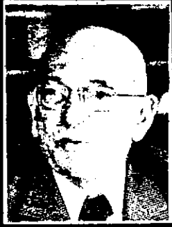
EDGAR FAURE (Francia), ex Presidente del Consejo, ex Ministro de Educación Nacional, Ministro de Estado encargado de Asuntos Sociales, presidente de la Comisión.