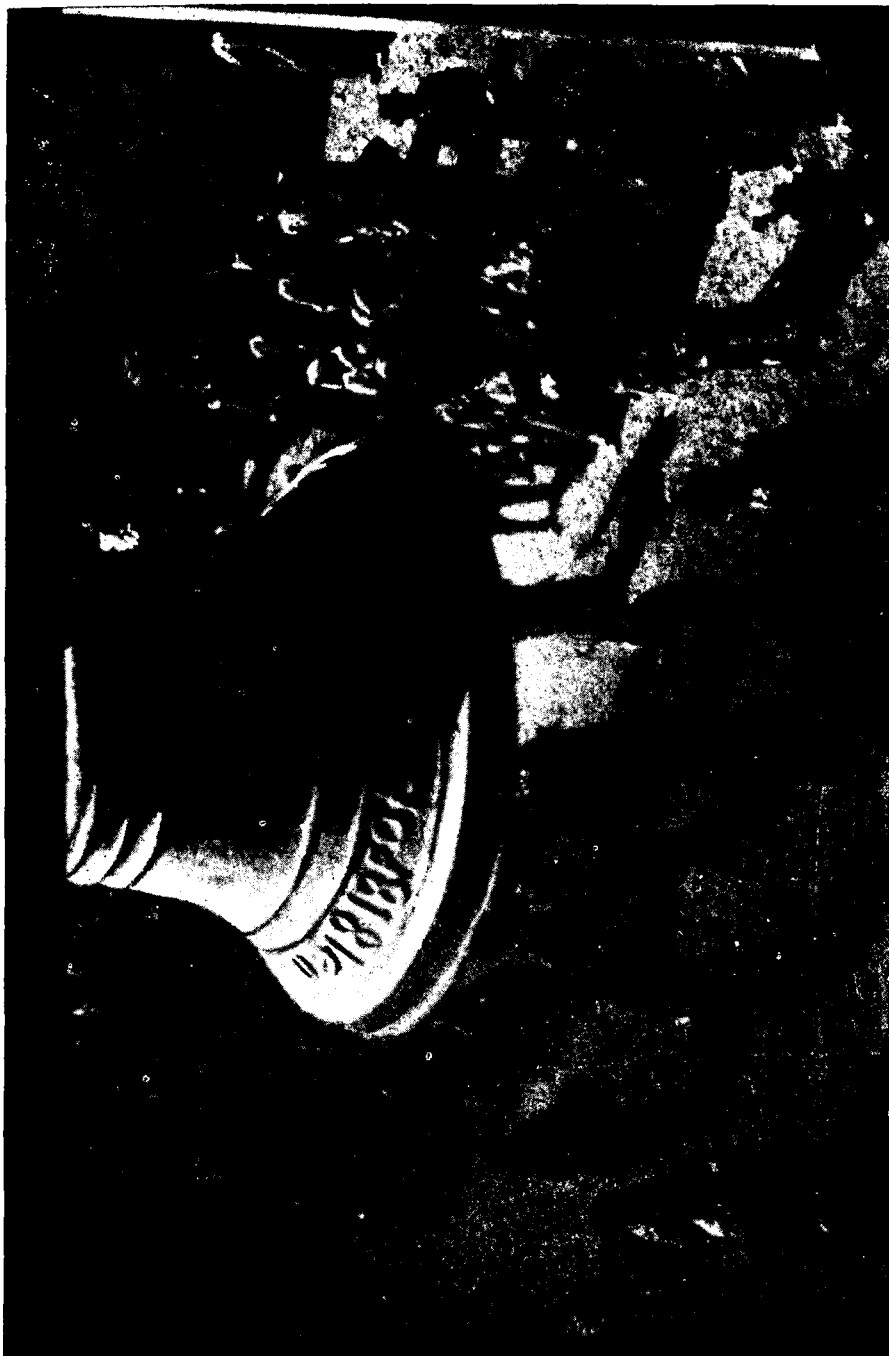
La danza ancestral de las Ilameras