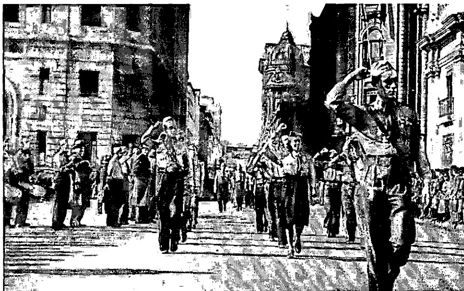
La Federación Juvenil Socialista desfila frente a la Moneda, en 1939. Las Milicias Socialistas enfrentaron en las calles a las Tropas Nazis de Asalto de Gustavo Von Maré.