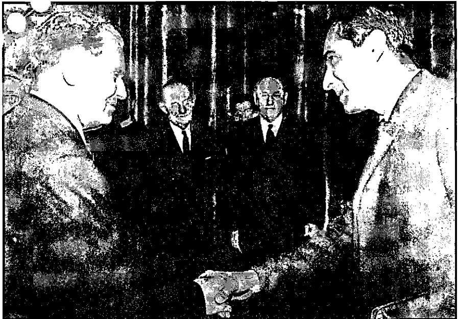
Con el Mariscal Tito, en Belgrado, ex Yugoslavia, durante los peores años de la Guerra Fría, sosteniendo la política de los No Alineados.