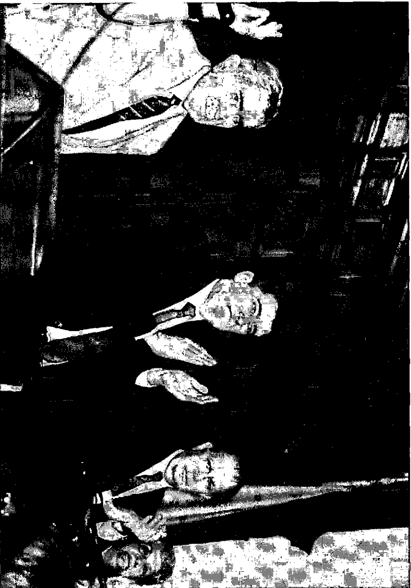
1996: Último Homenaje en el ex Congreso Nacional. De izquierda a derecha: Raúl Ampuero, el Diputado Camilo Escalona, Sec. General del PS, el entonces Ministro de Obras Públicas Ricardo Lagos y la ex Diputada Carmen Lazo.