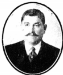
JOSE CARIAGA Primer Alcalde de Penco.