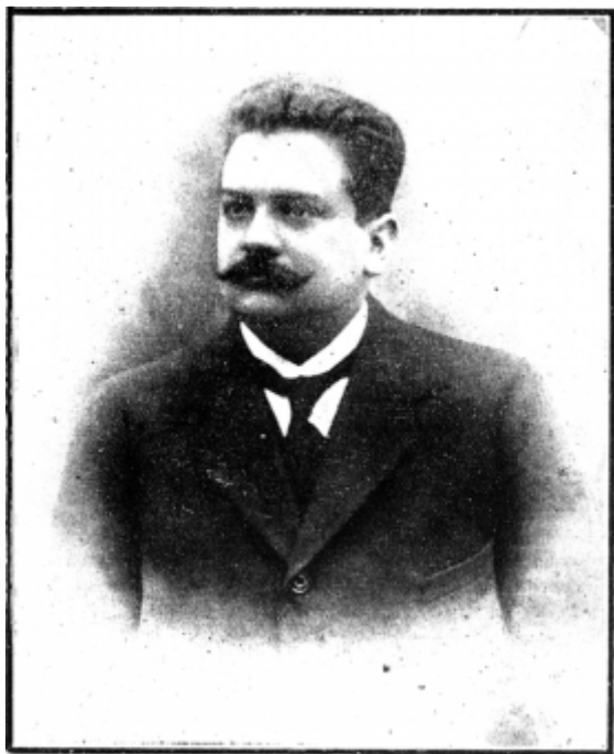
VICENTE ACUSA Intendente de Linares.