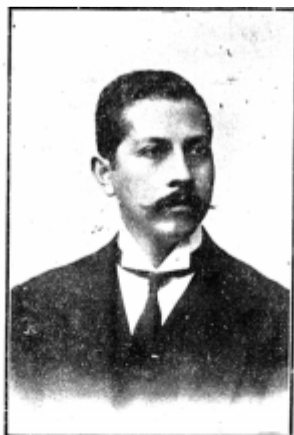
ARTURO BLANCO Laureado Escultor Nacional.