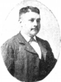
MANUEL GABATE Primer Alcalde de Quillicura.