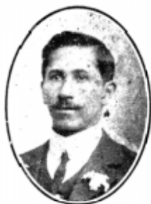
MANUEL J. BRIONES Primer Alcalde de Gorbea.