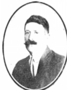
CLEMENTE ESCOBAR Ex-alcaldé de Valdivia.