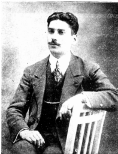
AMADOR DIAZ Alcalde de Quinta Normal.