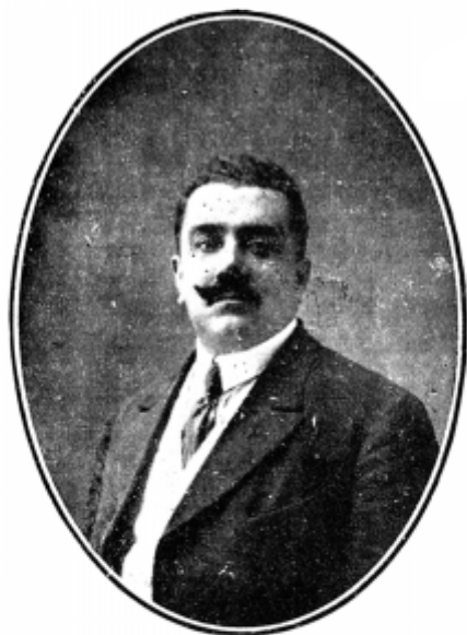
NOLASCO CARDENAS Diputado por Valdivia.