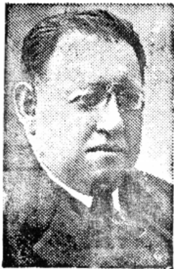
JUAN RAFAEL CARRANZA Reconocido Periodista de Santiago.