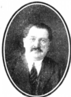
ABEL GALLEGOS Alcalde de Mulchén.