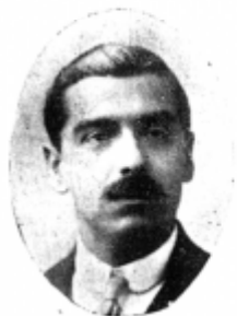
CARLOS FLORES Primer Alcaldé de Quinta Normal.