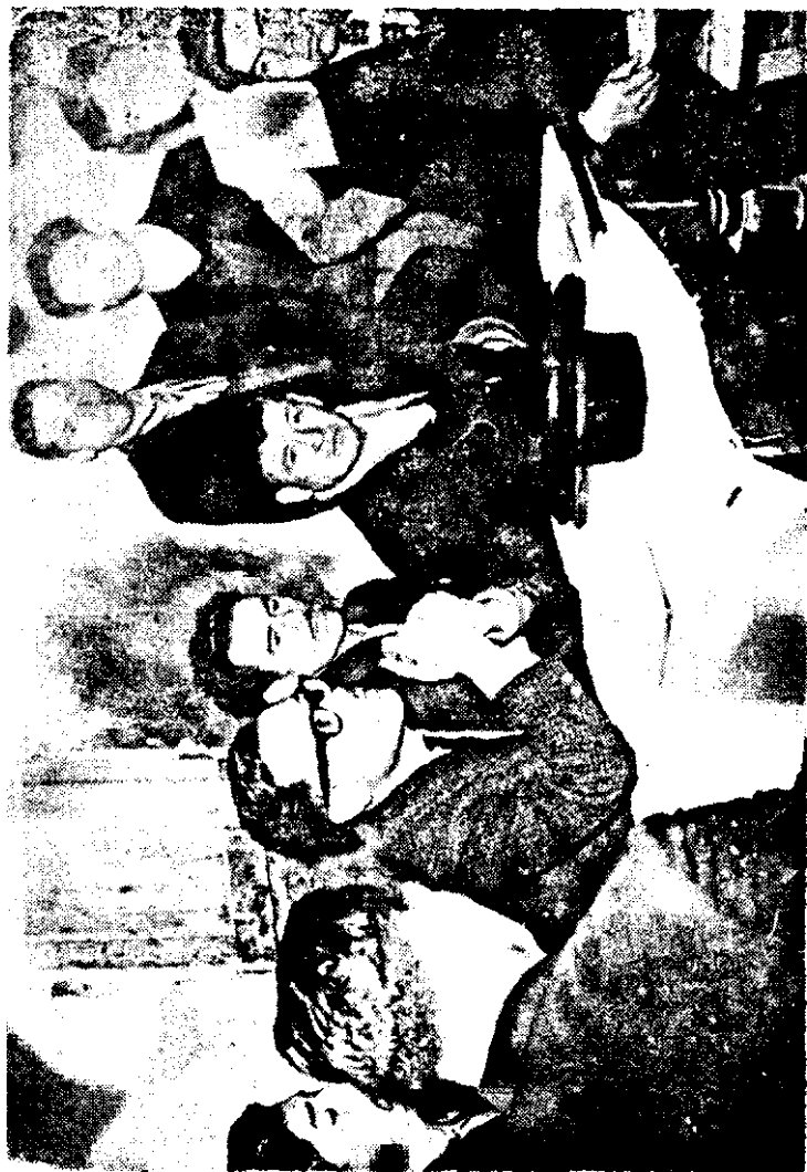
Las organizaciones campesinas son una conquista en sí.