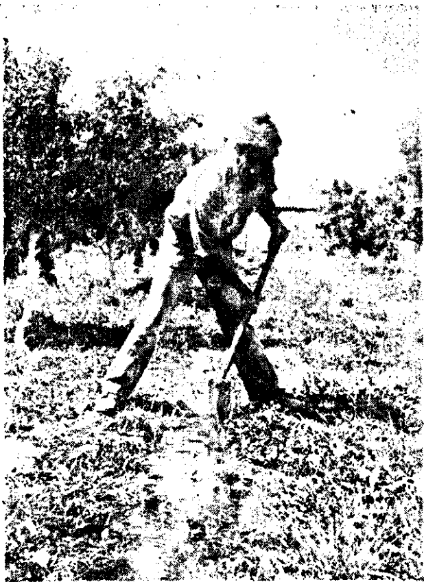
La tierra para quien la trabaja.