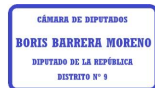
Boris Barrera Moreno Diputado de la República de Chile