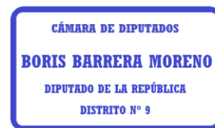
Boris Barrera Moreno Diputado de la República de Chile