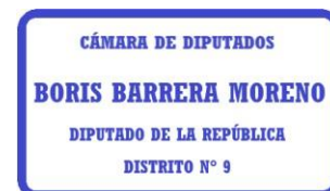
Boris Barrera Moreno Diputado de la República de Chile