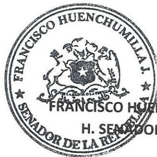
FRANCISCO HUENCHUMILLA JARAMILLO H. SENADOR DE LA REPUBLICA

Indico estar informado de la iniciativa juvenil de ley propuesta por el quipo DELIBERA 2018 del Colegio María Auxiliadora de Valdivia y suscribo mi Patrocinio a tal proyecto.