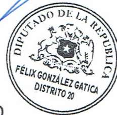
HONORABLE DIPUTADO SR. FÉLIX GONZÁLEZ GATICA