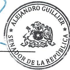
ALEJANDRO GUILLIER A. SENADOR DE LA REPÚBLICA

Brindo mi apoyo, en virtud de que este tipo de instancias son una excelente oportunidad para que los jóvenes puedan tener un acercamiento a las problemáticas de su entorno, permitiendo una sólida formación ciudadana.