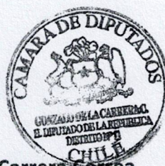
Diputado Gonzalo de la Carrera Correa