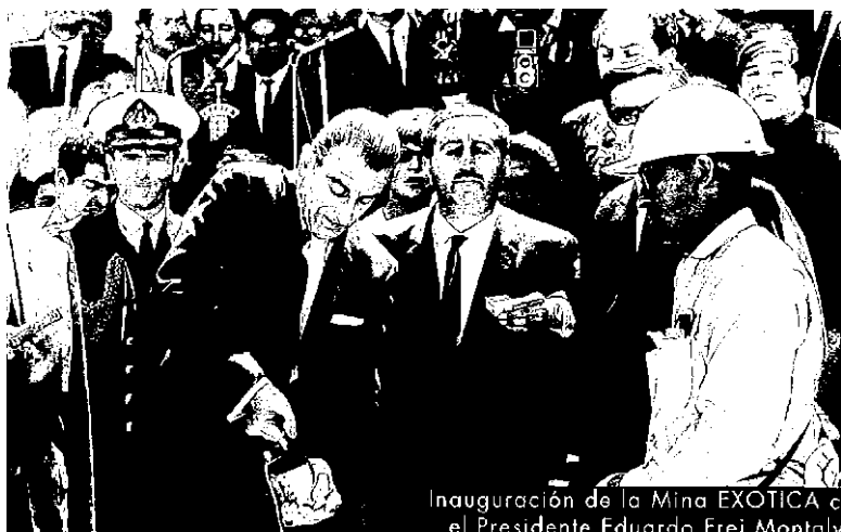
Inauguración de la Mina EXOTICA con el Presidente Eduardo Frei Montalva.