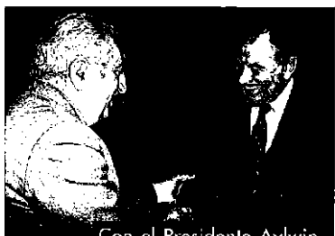
Con el Presidente Aylwin.

En 1966 es designado Ministro de Minería bajo el gobierno de Eduardo Frei Montalva, cargo que ocupa hasta 1970. A mando de esta cartera completa el plan de chilización del cobre, la nacionalización pactada de Chuquicamata y El Salvador e impulsa nuevos proyectos de industrialización, modernización, refinación y explotación, como la minera Andina. Pone en marcha el plan de expansión de la pequeña y mediana Minería.