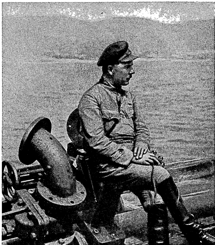
K. VOROSHILOV en 1921