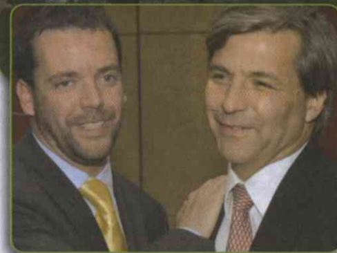
Junto al Presidente de la Asociación Nacional de Fútbol Profesional, Harold Mayne Nicholls.