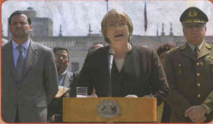
Junto a la Presidenta, Michelle Bachelet y al Ex Director General de Carabineros, José Alejandro Bernales.

Junto a esto, el diputado Harboe propone aumentar la presencia de la Policía de Investigaciones en la comuna; la instalación de cámaras de televigilancia para prevenir, reaccionar más rápido y probar ante los jueces los delitos filmados, para sancionar de manera efectiva a los delincuentes. La instalación de alarmas comunitarias gratuitas y mejorar la seguridad en condominios y edificios de la comuna, junto a la protección de vecinas en paraderos y liceos de Santiago en las horas de mayor circulación, son algunas de las medidas que propone para vivir más tranquilos.