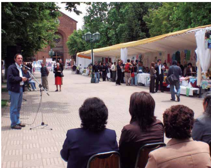
Exposición talleres 2011 Linares