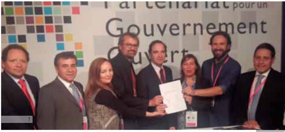
Foto 1: Firma de Acuerdo de co-creación del Plan de Acción de Parlamento Abierto con agrupaciones de la sociedad civil. (Paris, 2016)