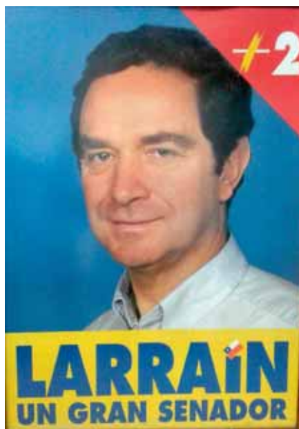
Segunda campaña año 2001