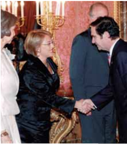
Foto 3: En 2010 fue invitado por la presidenta Michelle Bachelet a la XII Reunión del Comité Parlamentario Mixto y Cuarta Sesión Plenaria Ordinaria Eurolat, Sevilla.