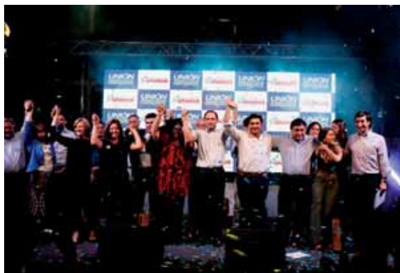
Foto 2: Como presidente de la UDI, el senador Larraín encabezó las elecciones municipales de 2016 con excelentes resultados obtenidos a nivel nacional. La Directiva Nacional hizo un reconocimiento a los ganadores de las elecciones.