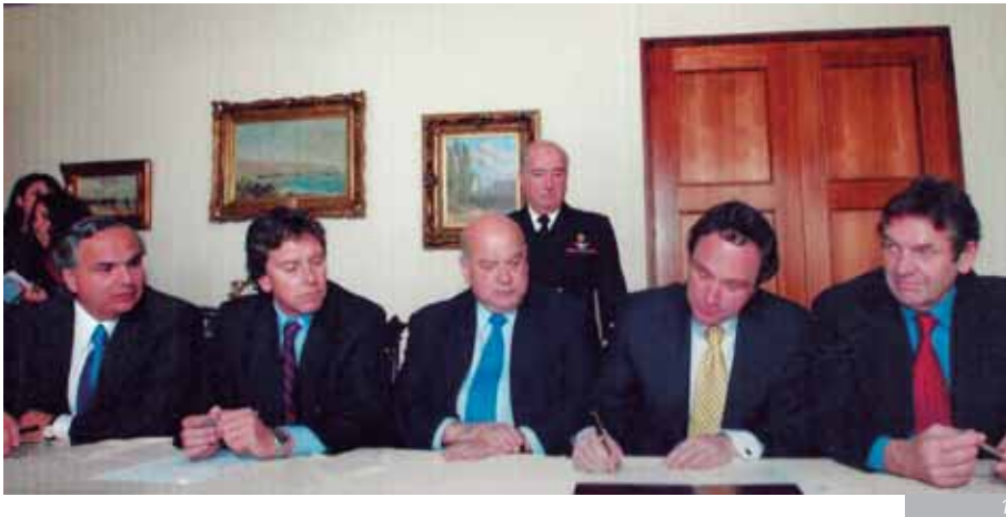
Foto 1: La reforma Constitucional del 2005 se alcanzó luego de un acuerdo político gestado por el senador Larraín, como presidente del Senado, en el año 2004, con las autoridades de la época: Ricardo Lagos, presidente de la República y José Miguel Insulza, ministro del Interior.

Integrante de la comisión de Constitución, Legislación y Justicia desde su primer periodo en 1994, la que también le correspondió presidir.