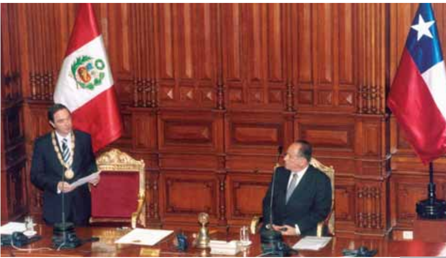
Foto 10: Senador Larraín recibe condecoración del Congreso del Perú. Además, fue condecorado por el gobierno peruano, por el Congreso de Colombia y por el Congreso de Paraguay.