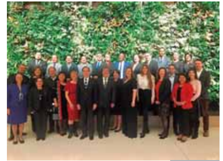
Foto 2: Representantes de países de América Latina se reunieron en octubre de 2017, en encuentro ParlAmericas realizado en Canadá, para debatir sobre la experiencia transparencia y probidad en la región. transparencia y probidad.