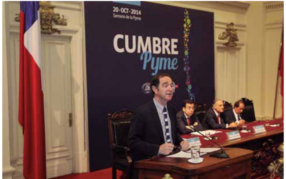
Foto 1: Miembro de la bancada de senadores Pro Pyme, Hernán Larraín tuvo una activa participación en la promoción de iniciativas que fueran en beneficio del desarrollo de la pequeña y mediana empresa.

En septiembre de 2017 entró en vigencia la "ley del saco", que reduce la carga máxima por persona de 50 a 25 kilos para proteger la salud de los trabajadores. La ley, de autoría del senador Larraín, estipula que quienes no cumplan con la nueva normativa se exponen a multas de 9 a 60 UTM, equivalente a $420 mil y $2 millones 800 mil. Las sanciones dependerán según la cantidad de trabajadores que sobrepasen el peso.