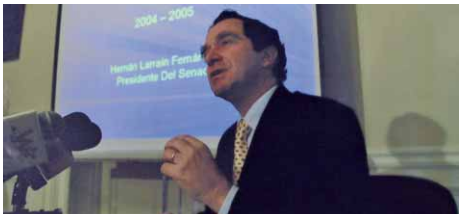
Foto 2: Senador Larraín en presentación del "Senado Ciudadano", impulsado desde la presidencia de la Corporación. Herramienta de transparencia que permitió la publicación de votaciones en comisiones y sala de los senadores, sus sueldos y gastos de las asignaciones parlamentarias en la web de la Cámara Alta.

Obtuvo la reelección por la misma Circunscripción con primera mayoría regional y segunda a nivel nacional. Integró las comisiones de Educación, Cultura, Ciencia y Tecnología, de Gobierno, Descentralización y Regionalización, de Agricultura y de Constitución, Legislación y Justicia. Le correspondió presidir estas dos últimas instancias. Como presidente del Senado (2004 - 2005) impulsó junto al ex senador Jaime Gazmuri, la actual Ley Sobre Acceso a la Información Pública. Además, es coautor de la más profunda Reforma Constitucional realizada desde el regreso a la democracia (2005).