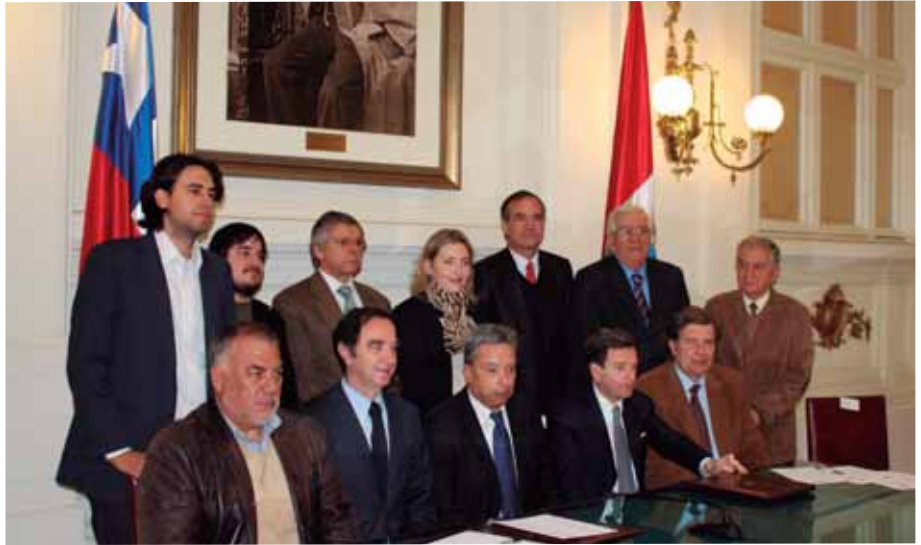
Foto 1: Antes de conocerse el fallo de la Haya por la demanda marítima del Perú, Hernán Larraín convocó un 18 de junio de 2013, a los presidentes de partidos políticos de Chile y Perú para compromiso de respeto ante fallo de La Haya.

“Me siento muy honrado de recibir a los representantes de los partidos políticos chilenos que han aceptado firmar este documento. Este es un acto inédito (...) Aceptar un fallo judicial es reflejo de ciertos elementos que son centrales en la vida republicana”