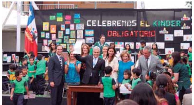
Foto 6: Senador Larraín en la promulgación de la Ley que establece kinder obligatorio (noviembre de 2013).