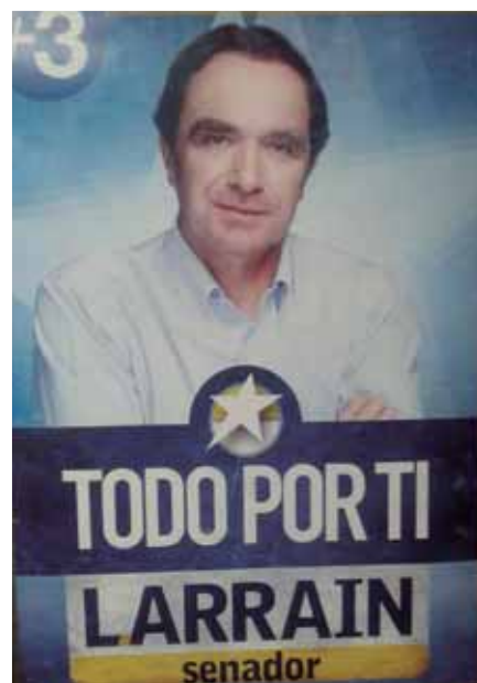
Tercera campaña año 2009