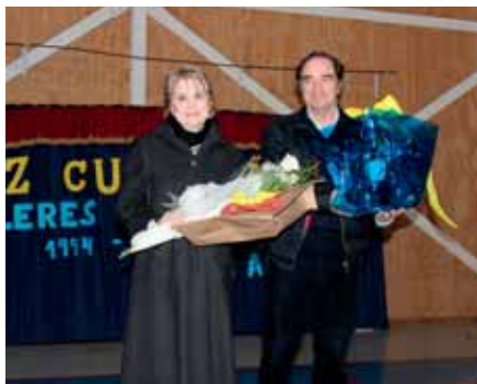
Foto 1: En Julio de 2017 participantes de los talleres agradecen el apoyo del Senador Larraín y de su señora Magdalena Matte.

Una iniciativa impulsada a partir de 1994 por el Senador Larraín y con el especial trabajo de su señora, Magdalena Matte. Los Talleres de Manualidades y Capacitación para Mujeres, buscan incentivar la capacitación y encuentro de mujeres con apoyo organizativo y entrega anual de beneficios, con un sistema de financiamiento compartido.