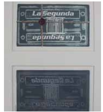
Elegido "Mejor Senador" en los años 2002, 2005 y 2007, en encuesta realizada a senadores por el vespertino La Segunda.

Hasta octubre de 2017 el Senador Hernán Larraín tenía presentado 177 mociones, de las cuáles 20 de ellas son actualmente Leyes de la República. Adicionalmente, presentó 158 proyectos de acuerdo, realizó 2.409 intervenciones en Sala y tuvo una de las más altas asistencias con un 96% en los 24 años en ejercicio del cargo.