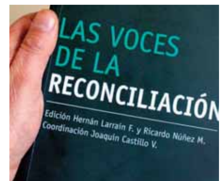
Foto 4: En agosto de 2008 el senador Hernán Larraín hizo un llamado al reencuentro y el perdón entre los chilenos en torno a los hechos ocurridos a partir del 11 de septiembre de 1973, durante el lanzamiento del libro "Las voces de la Reconciliación", del cual es editor