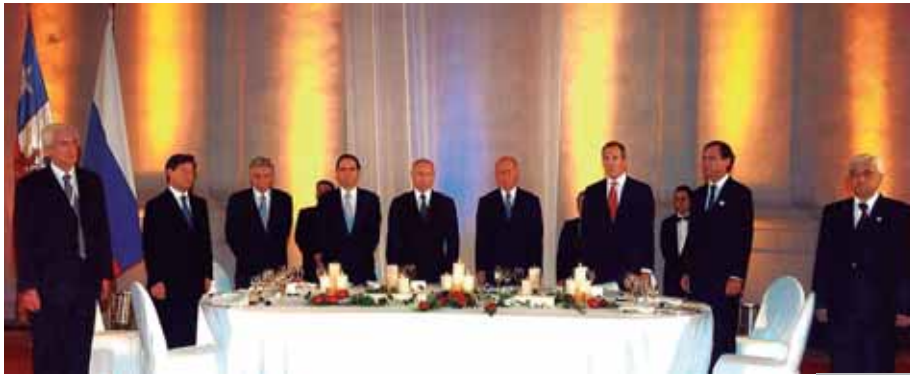
Foto 9: Cena de presidentes de Estado, Apec 2004 ofrecida por el presidente Ricardo Lagos junto al mandatario ruso, Vladimir Putin.