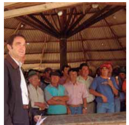
Foto 3: En reunión con agricultores remolacheros, exigiendo salvaguardia ante competencia desleal extranjera.

Los pequeños agricultores. Entre las materias que trató durante su período, destacan: defendió los derechos de los remolacheros concretando cambios a la ley de salvaguardias; se preocupó de los maiceros del Maule Sur en casos de dumping; apoyó los derechos de los regantes ante intentos de expropiación; exigió el funcionamiento de Cotrisa para regular el precio del trigo; promovió el acceso a beneficios de los arroceros de Parral, Retiro y Longaví; impulsó el sector agrícola y defendió a los agricultores.