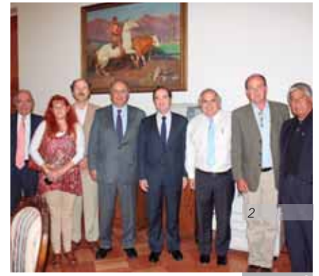
Foto 2: En 2013 el Senador intercede para que el ministro del Interior, Andrés Chadwick, y el ministro de Agricultura, Luis Mayol escuchen las demandas de los regantes del Maule Sur, quienes reclamaban igualdad de derechos en el uso de aguas en la región.

Foto 1: Debido a intensas heladas que afectaron a pequeños y medianos agricultores en septiembre de 2013, Hernán Larraín, como presidente de la Comisión de Agricultura, encabezó diversas acciones que permitieron que el gobierno declarara zona de emergencia a las regiones afectadas y diera curso a un plan agrícola con medidas propuestas por el Senador.