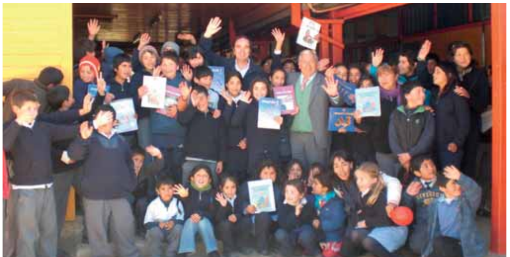
Foto 2: Senador Larraín hace entrega de libros en la escuela Candelaria Pérez de Alquihue, San Javier.

Para complementar o crear bibliotecas completas, es que, a partir de 1995, se comenzó con la entrega de textos escolares, de lectura obligatoria para enseñanza básica y media, así como de apoyo a profesores de establecimientos educacionales de las comunas.