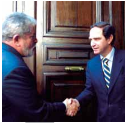
Foto 8: Siendo presidente de la Cámara Alta recibió la visita oficial del ex mandatario brasileño Lula Da Silva. (2004)