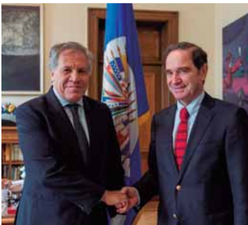
Foto 3: En reunión con Luis Almagro OEA, analizando rol de parlamentos del hemisferio en Agenda de Transparencia y Probidad.