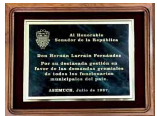
Foto 3: Senador Larraín recibe reconocimiento de los trabajadores municipales del país, (1997).