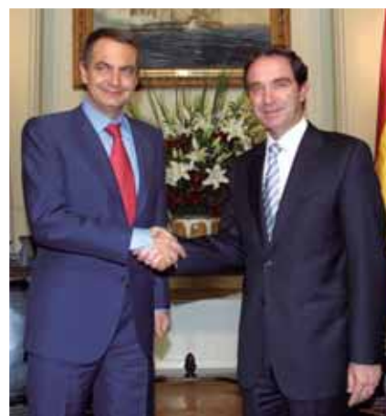
Foto 4: Presidente del Gobierno de España, José Luis Zapatero visita el Congreso Nacional (enero 2005).