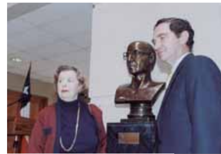
Foto 1: En 2006, siendo Presidente de la Cámara Alta, el Senador Larraín inauguró un busto del ex senador Jaime Guzmán. La ceremonia de presentación contó con la presencia de Carmen Errázuriz, madre del fundador de la UDI.

Foto 2: Como presidente de la UDI, el senador Larraín encabezó las elecciones municipales de 2016 con excelentes resultados obtenidos a nivel nacional. La Directiva Nacional hizo un reconocimiento a los ganadores de las elecciones.