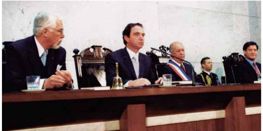
Foto 2: Siendo presidente del Senado en 2004, Hernán Larraín encabezó el Mensaje Presidencial de Ricardo Lagos Escobar.