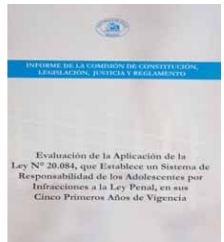
Foto 2: En 2013 a cinco años de la entrada en vigencia de la Ley 20.084 que establece responsabilidad de los adolescentes de infracciones de la ley penal, como presidente de la Comisión de Constitución, el senador Larraín, documentó un exhaustivo análisis de la Ley con el objetivo de buscar mejoras hechas por la Comisión.

"Esta reforma tiene por propósito cumplir una obligación que curiosamente el Congreso no tiene pese a que todas las instituciones tienen el deber de rendir cuenta. Es cierto que la Cámara de Diputados hace una cuenta voluntaria anual pero no se hace en forma solemne ni es una rendición que implique cumplir una responsabilidad con la ciudadanía", Hernán Larraín.