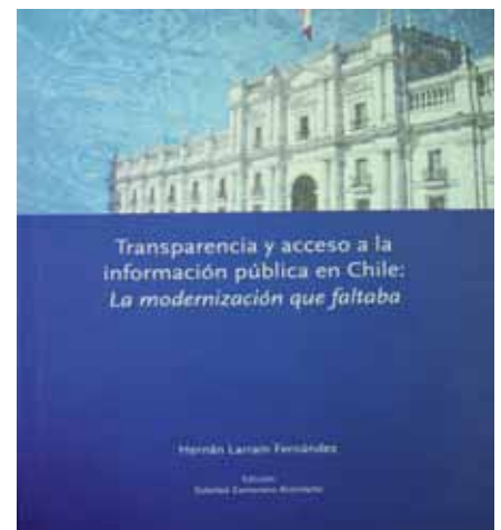
Foto 3: El 2005 publica el libro que explica el proyecto de ley de transparencia y acceso a la información pública.