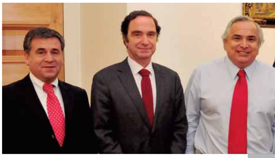
Foto 1: En reunión con el ex ministro del Interior Andrés Chadwick, junto al diputado Romilio Gutierrez, el senador Larraín presentaban nuevos diagnósticos que avalaban la creación de la nueva Región.

"Hemos alcanzado muchas metas, pero también nos quedan objetivos por alcanzar"