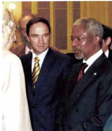
Foto 2: Con el Secretario General de las Naciones Unidas, Kofi Annan en Cumbre de la Unión Europea y el Caribe (2006).