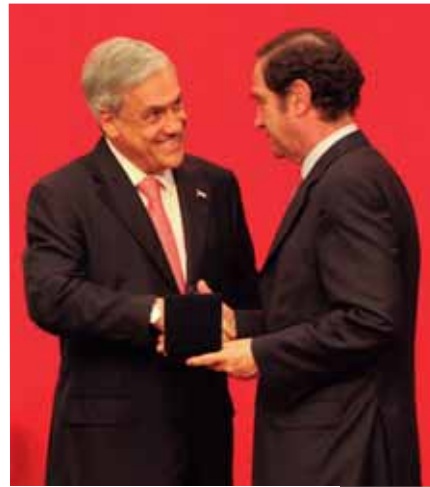
Foto 4: Senador Hernán Larraín recibe distinción del gobierno de Sebastián Piñera.