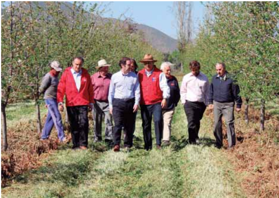
Foto 1: Debido a intensas heladas que afectaron a pequeños y medianos agricultores en septiembre de 2013, Hernán Larraín, como presidente de la Comisión de Agricultura, encabezó diversas acciones que permitieron que el gobierno declarara zona de emergencia a las regiones afectadas y diera curso a un plan agrícola con medidas propuestas por el Senador.

El trabajo conjunto con gremios del sector y su presencia constante en las instancias legislativas competentes, dieron importantes resultados en favor del gran aporte que día a día entregan los agricultores del país. Como Presidente de la Comisión de Agricultura y durante sus tres periodos legislativos, apoyó las demandas laborales de los trabajadores del sector y buscó soluciones a las diversas problemáticas a las que se enfrentan, en especial,