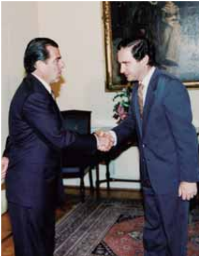
Foto 1: En visita protocolar con el presidente de la República Eduardo Frei Ruiz-Tagle (1994-2000).