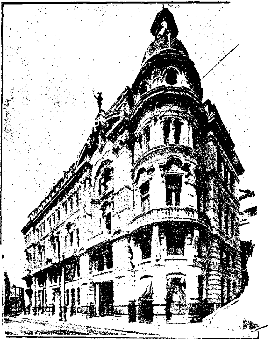
Edificio de "El Mercurio" en Valparaíso.