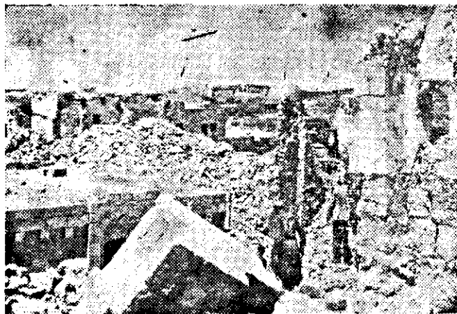
Ruinas y destrucción provocadas por los judíos en la zona de las reliquias históricas y religiosas. Su necesidad; la destrucción de los Lugares Sagrados