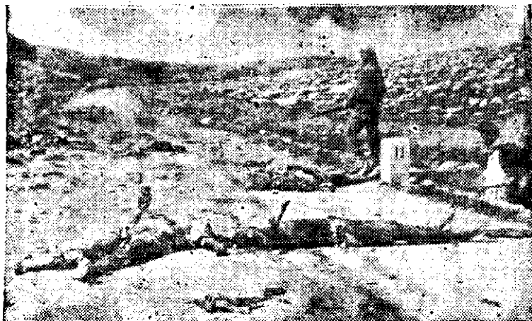
Guardias de la "LEGION ARABE" montan guardia, a los restos de civiles masacrados. Los judíos ¡no sólo mataron a los inocentes, sino que se ensañaron mutilándolos!