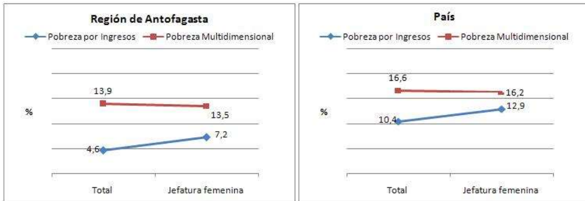
Figura 3. Pobreza por Ingresos y Multidimensional en Total de Hogares y Hogares con Jefatura Femenina, regional y nacional