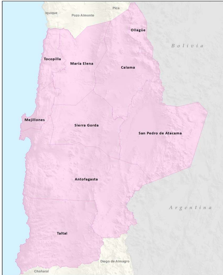
Figura 1. Nueva Circunscripción Senatorial 3 y Nuevos Distritos Electorales