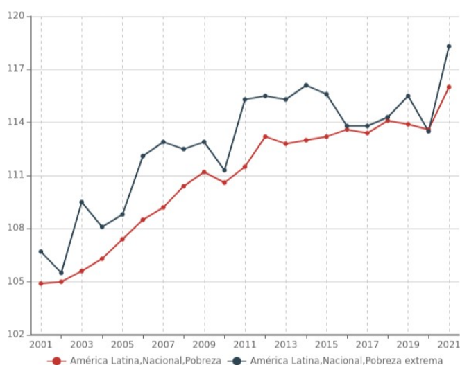
Gráfico 2. Índice de feminidad de la pobreza extrema y de la pobreza según área geográfica

Ahora bien, esta desigualdad y pobreza no afecta a toda la población de manera homogénea. Factores como el género o la pertenencia a un grupo étnico son determinantes para comprender cómo se reproduce esta desigualdad y en base a qué jerarquías, nos indica también donde debemos implementar políticas de ayuda y empoderamiento y qué actores sociales se encuentran con mayores dificultades a la hora de enfrentar la crisis y la inseguridad. Para esto, revisemos el siguiente gráfico de Cepal.